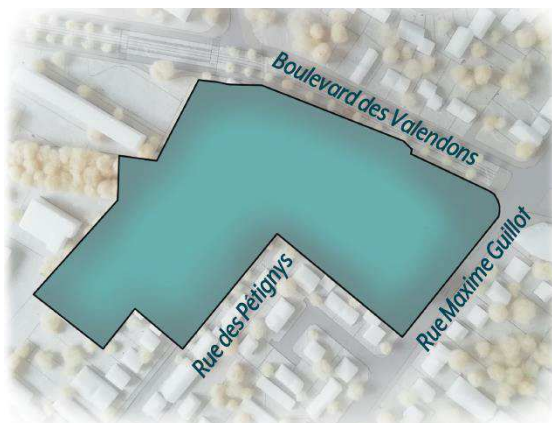
Projet de périmètre de l'opération