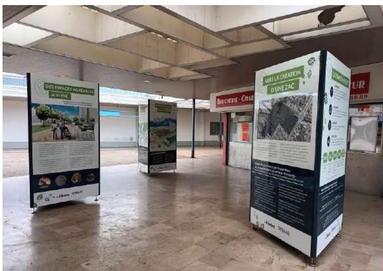
Exposition installée dans la galerie du centre commercial « Kennedy »