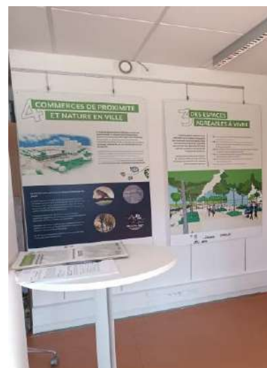
Exposition installée à la Maison du Projet